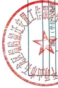
部门整体支出绩效自评情况表